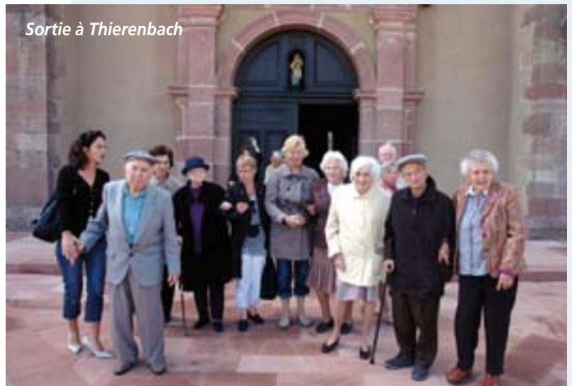
Sortie à Thierenbach

les résidents ne sortent de la structure et se retrouvent perdus à l'extérieur dans des conditions climatiques parfois rudes. Les résidents peuvent sortir soit avec leur