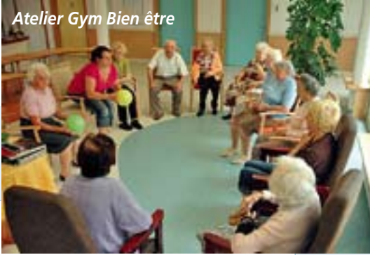
Atelier Gym Bien être

La présence des familles est également souhaitable régulièrement pour partager la nouvelle vie de son parent et que tous les moments de rencontre sont pleinement partagés. Les familles, si elles le désirent, participent aux activités, aux sorties, aux repas, en collaboration avec le personnel spécifiquement formé.