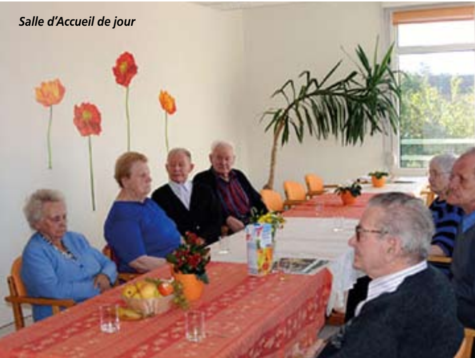
Salle d'Accueil de jour